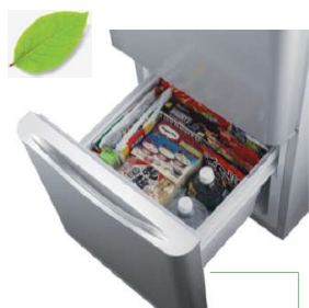
Congélateur-tiroir en grande capacité