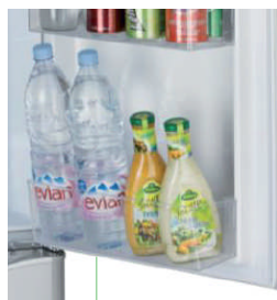
Balconnet contre porte en pente