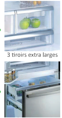
3 tiroirs extra larges