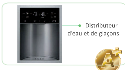
Distributeur d'eau et de glaçons