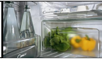
TABLE TOP CFOE 5482 W